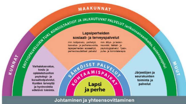
Kuva: Perhekeskuksen palveluverkosto

Perhekeskustoimintamallissa yhdyspintoja syntyy maakunnan sote-palvelujen, kunnan sivistyspalvelujen (varhaiskasvatus ja koulu) ja muiden terveyttä ja hyvinvointia edistävien palvelujen sekä järjestöjen ja seurakuntien palvelujen välille. Lapset ja perheet odottavat sujuvaa palvelua, hyvää yhteistyötä toimijoiden välillä sekä apua ja tukea nopeasti ja laadukkaasti. Hihat on käärityt, kehittämistyö on Etelä-Pohjanmaalla täydessä vauhdissa. Yhteistyörakenteista ja käytännöistä sovitaan eri toimijoiden kesken. Toimintakulttuuria uudistetaan Lapen toimintaperiaatteiden avulla. Lapset, nuoret ja perheet otetaan mukaan toimintaa arvioimaan ja kehittämään.