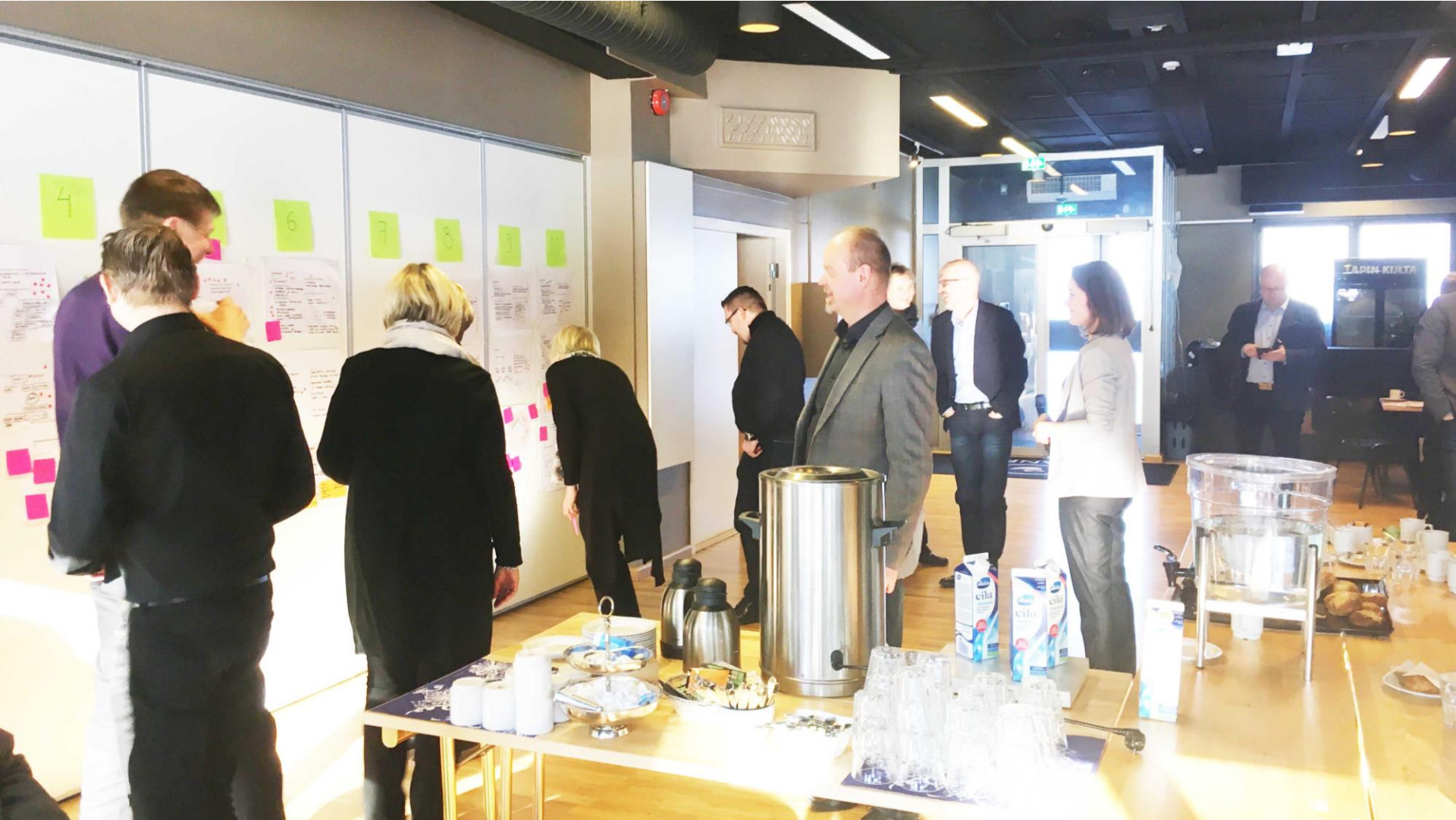
Yrittäjiä ja elinkeinotoimijoita työpajassa maaliskuussa 2018