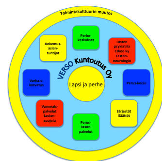
Kuva 2. Monitoimijainen yhteistyörakenne